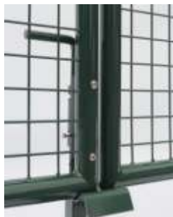
Bodenschieber beidseitig verwendbar