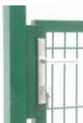
Schloßanschlag Doppelstabtür aussen