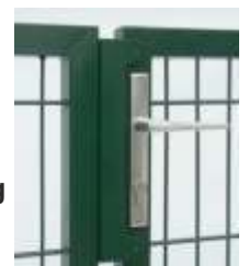
Schloßanschlag Doppelstabtor 2-flügelig