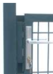
Schloßanschlag Doppelstabtür innen