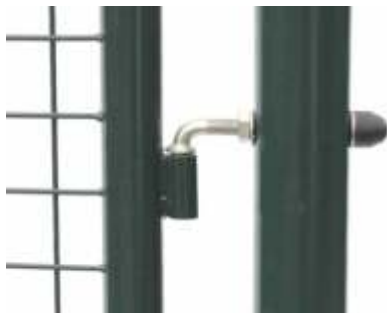
Diebstahlsicherung durch den oberen Kloben