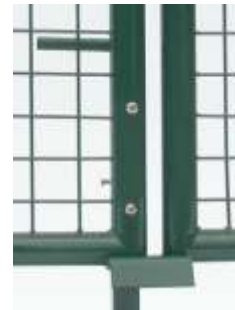
Bodenschieber zusammen mit dem Auflaufbock